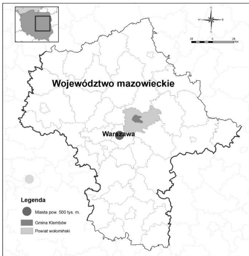
Mapa 1 Położenie Gminy Klembów na tle woj. mazowieckiego i powiatu wołomińskiego