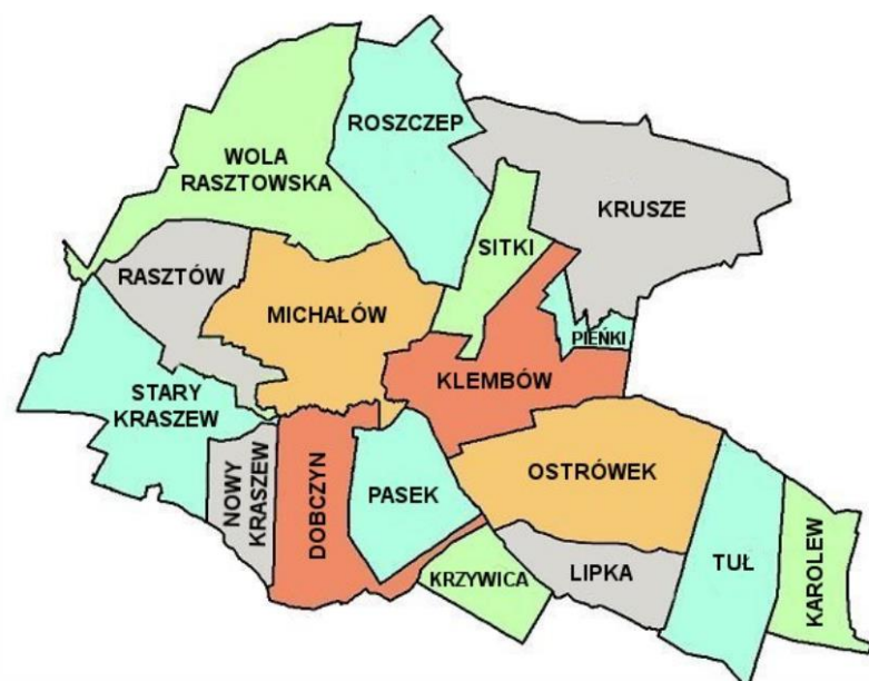
Mapa 2 Mapa sołectw w Gminie Klembów