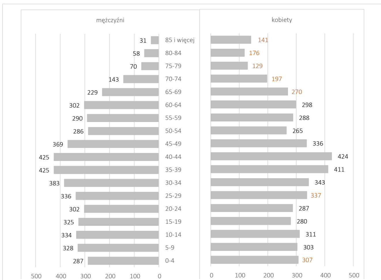
Wykres 1 Ludność według płci i wieku w 2019 r.